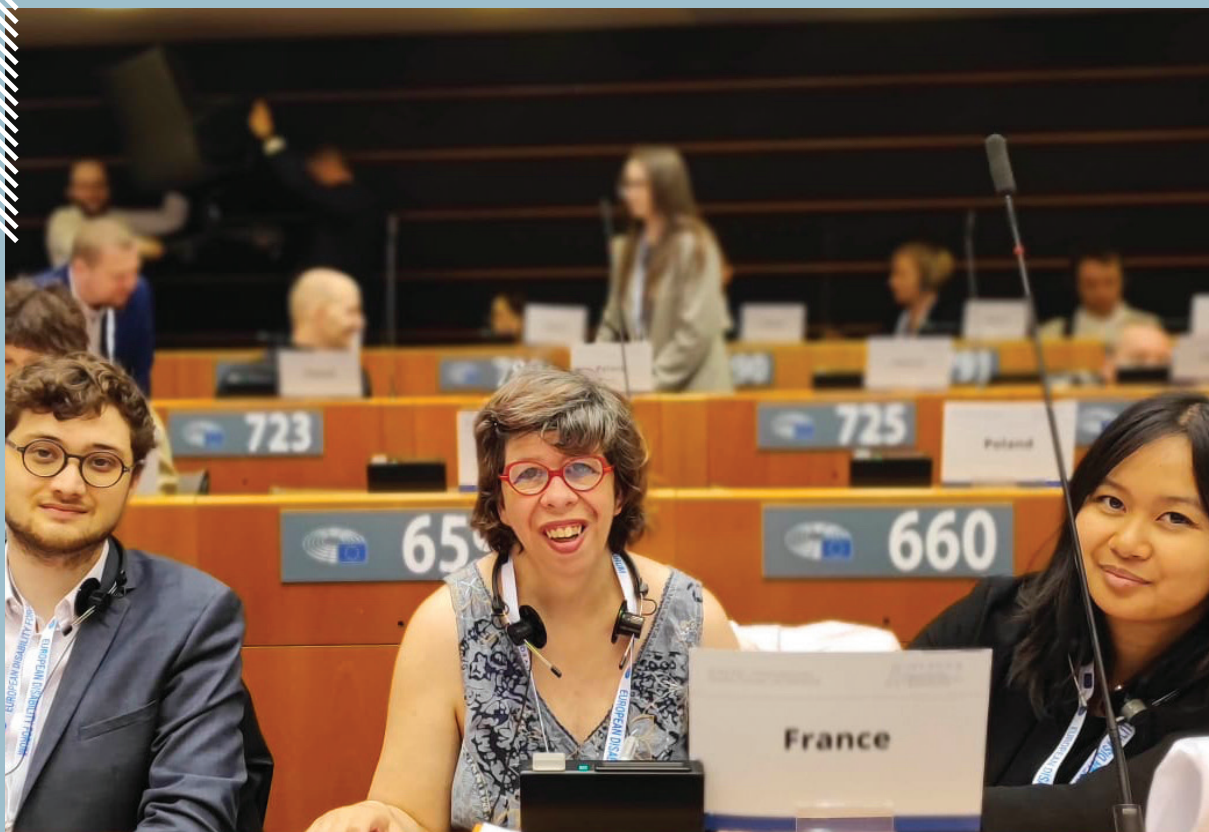
Dans l'hémicycle du Parlement Européen lors de la réunion de Nous Aussi avec l'association Inclusion Europe