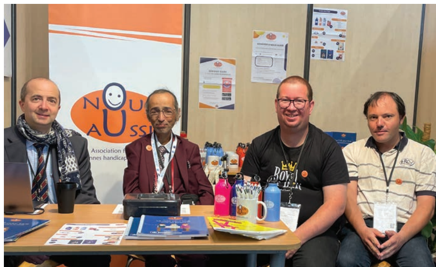
Réunion avec l'association Inclusion Europe au Parlement Européen à Bruxelles avec une délégation d'autoreprésentants.

Nous Aussi est membre du CNCPH, le Conseil National Consultatif des Personnes Handicapées, et siège